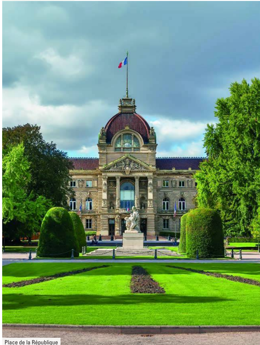
Place de la République