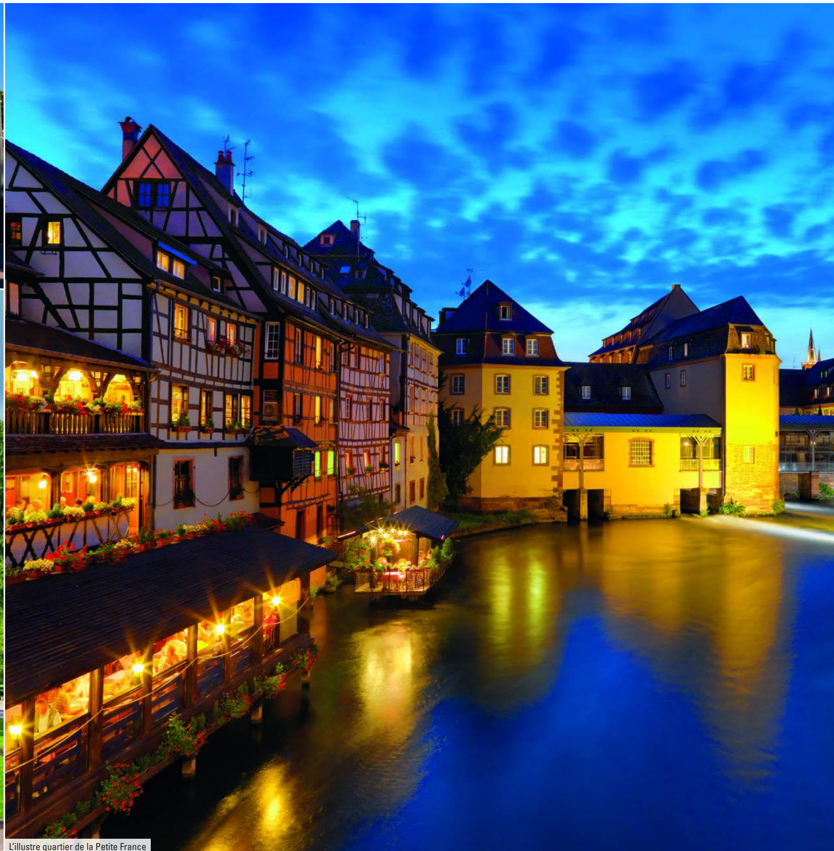
L'illustre quartier de la Petite France