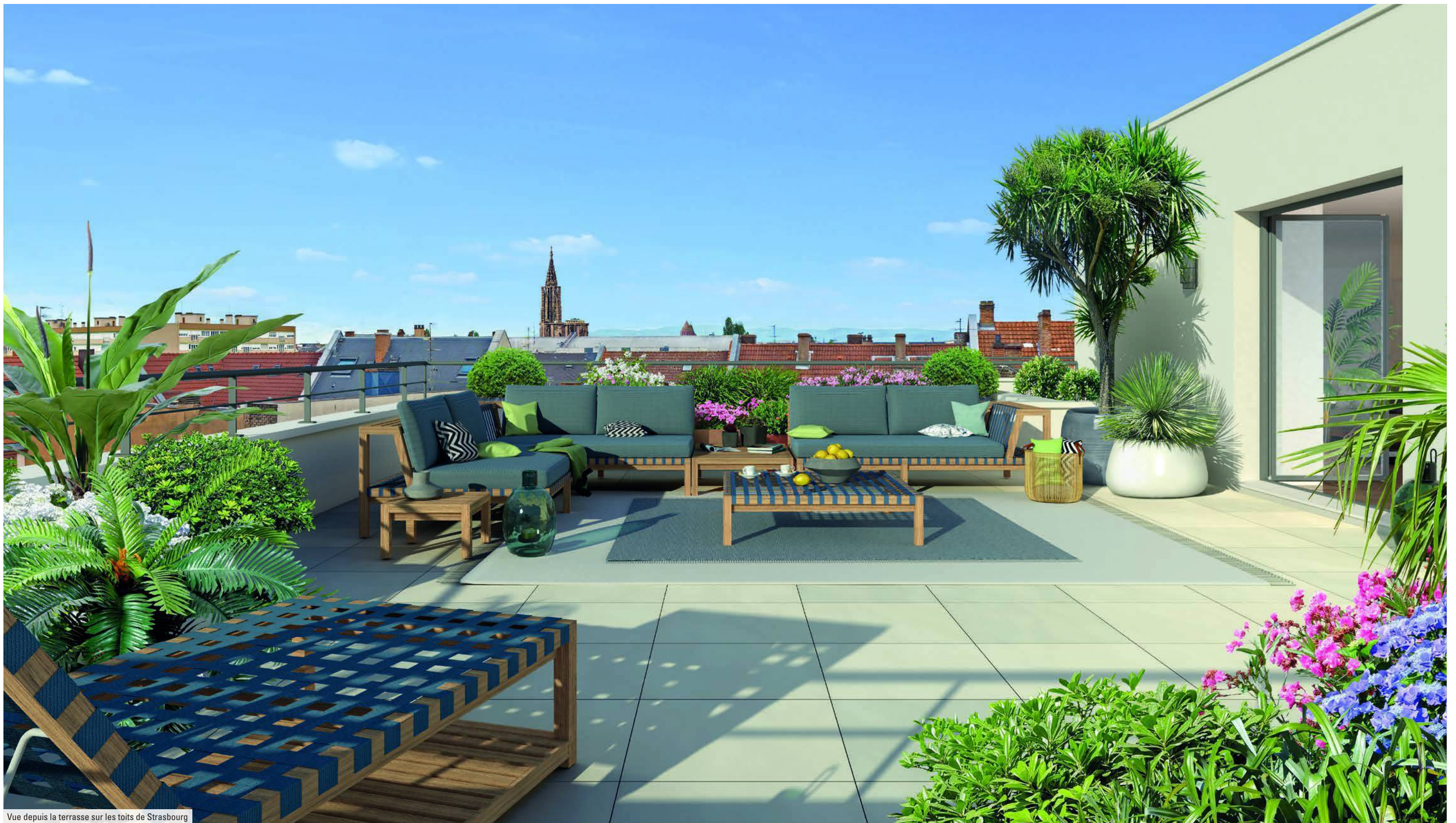
Vue depuis la terrasse sur les toits de Strasbourg