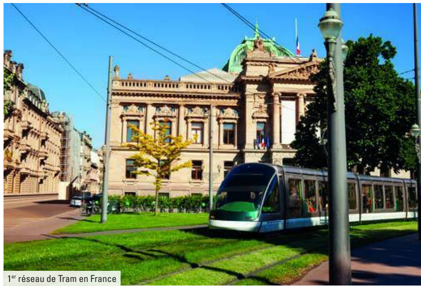
1 er réseau de Tram en France