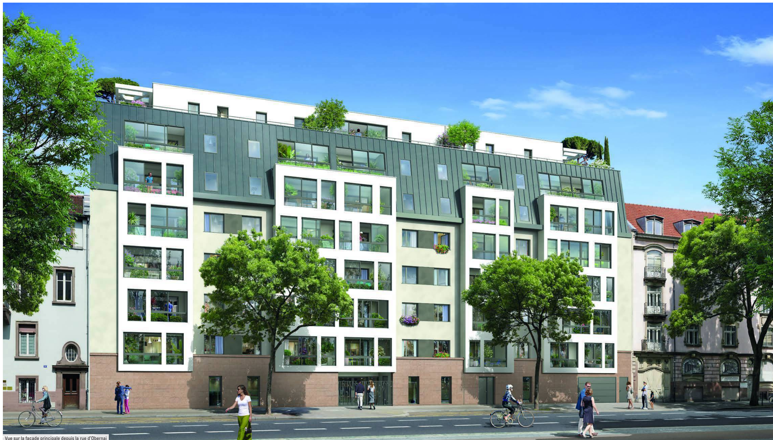
Vue sur la façade principale depuis la rue d'Obernai