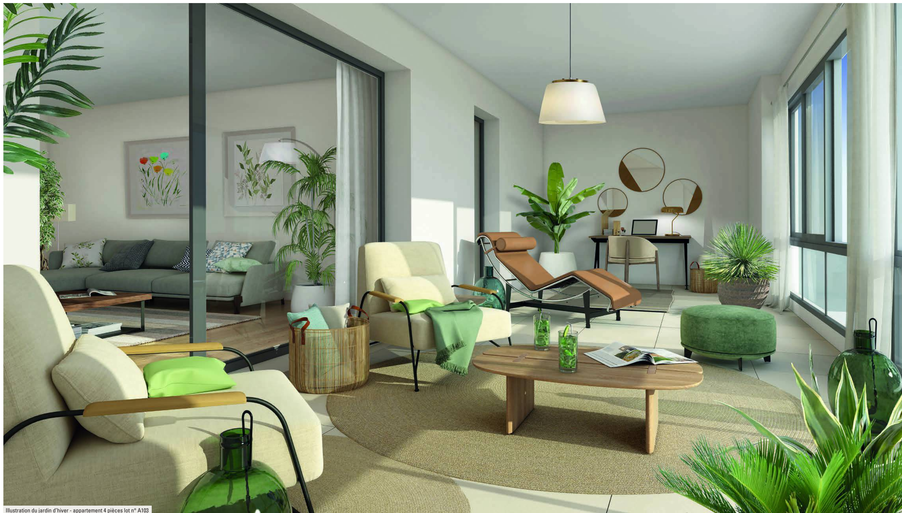
Illustration du jardin d'hiver - appartement 4 pièces lot n° A103